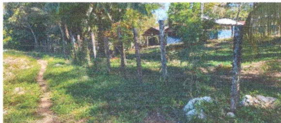
Foto 6: se observa el deterioro del cercado, se priorizo el cercado del muro por la seguridad de los niños ya que la escuela se ubica en la orilla del asfalto.

Observación: Si es necesario se pueden agregar hojas adicionales y actualizar el número de hojas.